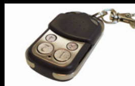
Telecomando wireless incluso.