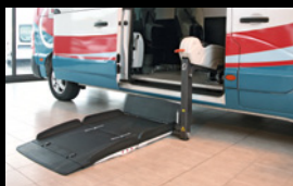
Sollevatore Fiorella su porta laterale.